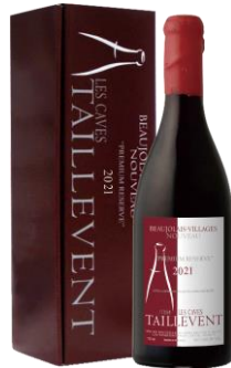
ボジョレー・ヴィラージュ・ヌーヴォー「プレミアム・レゼルヴ」