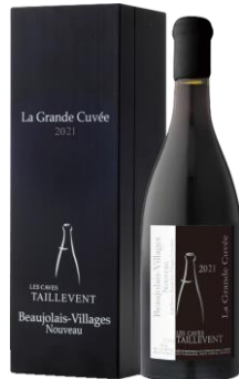
ボジョレー・ヴィラージュ・ヌーヴォー「ラ・グランド・キュヴェ」