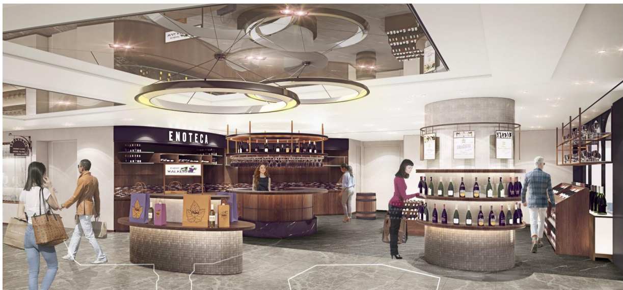
↑ ワインショップ・エノテカ グランド・ウォーカー・ヒル店(イメージ)