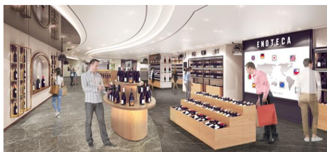
↑ 世界のワイン産地を記したワインマップディスプレイ(イメージ)。

ソウル市の広津区に位置する「グランド・ウォーカー・ヒル」は、1963 年 4 月に開館した 5 つ星ホテルで、漢江が一望できる岷嶮山の麓にあり美しい展望を誇ります。ホテル内にカジノを併設し、デリやショップ等が入居する複合型リゾート施設となっています。定期的にワインフェアを行っている場所としても知られ、ワインイベント開催時はそのためだけに「グランド・ウォーカー・ヒル」を訪れるワインラヴァーも多くみられます。またエリア周辺の広津区広壮洞は新高級住宅地としても知られています。