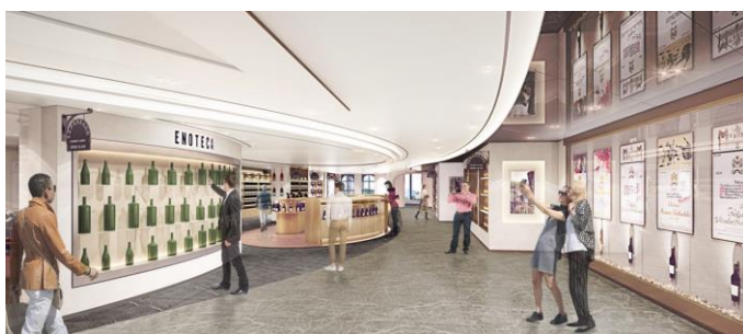
↑ 店内に至るアプローチ沿いに配された、ムートン・ギャラリー。世界的に著名なアーティストのリトグラフが展示されます(イメージ)。

こうしたアートの展示やソムリエナイフのディスプレイなど、お客様が「写真を撮りたくなる」、「見るだけでも楽しい」という仕掛けを店内随所に展開し、ワインについての様々な発見を促すことをコンセプトとした店づくりとなっています。