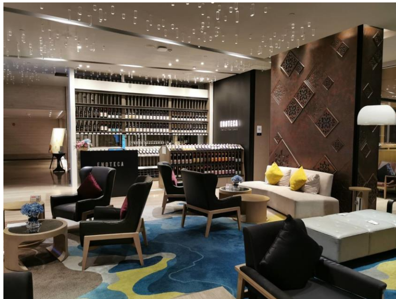
↑ 「ホテル ノホテル バンコク スクンビット 20」のロビーフロアに出店。ロビーのソファやテーブル席にも、エノテカショップで購入したワインを持ち込んでお楽しみいただけます。

このシステムはホテルとの共同プロジェクトで初めて可能となったもので、ホテルで飲むワインは高額であるという一般的概念を覆す試みとなり、高良質なワインを多くのお客様に体験していただく機会を実現することになります。