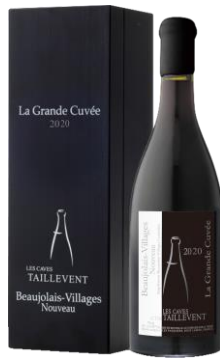
ボジョレー・ヴィラージュ・ヌーヴォー“ラ・グランド・キュヴェ”