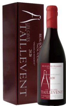
ボジョレー・ヴィラージュ・ヌーヴォー“プレミアム・レゼルヴ”