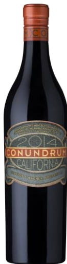
コナンドラム・レッド