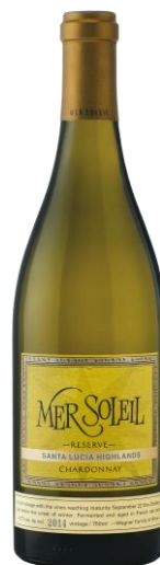
メール・ソレイユ リザーヴ・シャルドネ